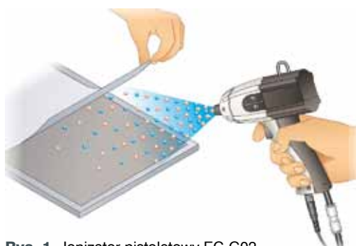
Rys. 1. Jonizator pistoletowy EC-G02

Innym produktem, który łączy zalety wiatrakowego i listwowego jonizatora w jednej obudowie to jonizator DC ER-