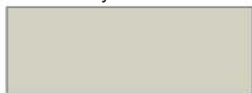
Miedziany kod 35&41