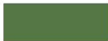
Zielony kod 04