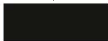
Czarny kod 18