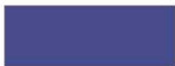
Niebieski kod 02