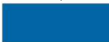
Jasnoniebieski kod 08