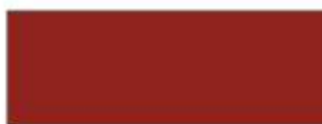
Rubinowy kod 03