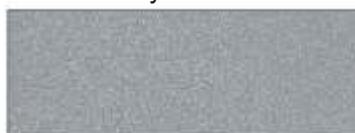
Jasnoszary kod 38