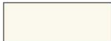
Biały kod 21