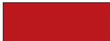
Czerwony GWS kod 25