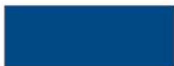
Niebieski GWS kod 07